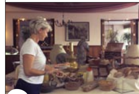
Optioneel gebruik maken van het luxe ontbijtbuffet