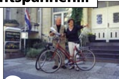
Fietsroutes voor jong en oud