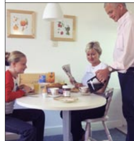
Of heerlijk lunchen in uw eigen appartement