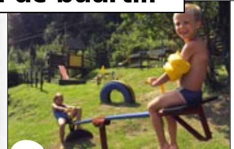
Een ruime speeltuin voor ieders wat wils

In ons verwarmde buitenbad kunt u heerlijk ontspannen. De ligstoelen op het terras nodigen uit om ieder zonnestraaltje mee te pikken. Voor de kleintjes is er een ruime speeltuin met diverse toestellen om lekker te ravotten.