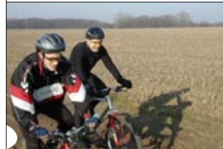
Voor mountainbiken is alle ruimte